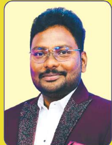
నూనె అనుదీప్ అధ్యక్షులు