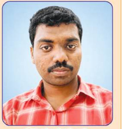
కొత్త రత్తయ్య ప్రెసిడెంట్ : పొన్నలూరు