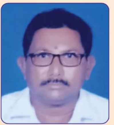
మట్ల సుబ్రహ్మణ్యం ఉపాధ్యక్షులు