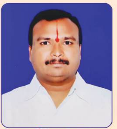
కొండవేటి వడ్డికాసులు ఉపాధ్యక్షులు