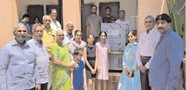
ఉయ్యూరు,కలంకొంటర్ : విద్యనభ్యసించిన కళాశాలకు తమ సహచర విద్యార్థి స్మారకార్ధం లక్ష రూపాయలు విలువ చేసే వస్తువులు