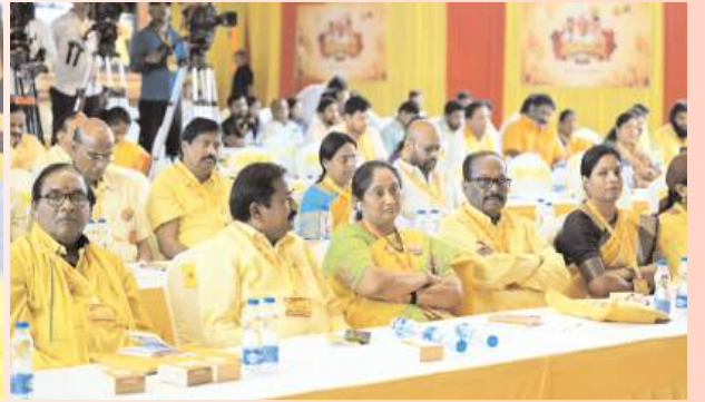
అమరావతి, కలంకౌంటర్ : తెలుగుజాతికి వెలుగై నిలిచిన స్వర్ణీయ సందమూరి తారక రామారావుకు భారతరత్న ఇవ్వాలనేది ప్రజలందరి

డిమాండ్ అని ముఖ్యమంత్రి చంద్రబాబు నాయుడు అన్నారు. దేశరాజకీయాల్లో పెనుమార్పులకు నాంది పలికిన మహోన్నత నాయకుడికి భారతరత్న ఇవ్వాలని ఆయన కోరారు. ఎన్టీఆర్ జయంతినీ పురస్కరించుకుని గురువారం మహానాడు రెండో రోజున ఎన్టీఆర్ కు నివాళి అర్పించే తీర్మానంపై సీఎం చంద్రబాబు ప్రసంగించారు. తెలుగు జాతి ఆత్మగౌరవానికి ప్రతీకగా నిలిచిన మహానేత, విశ్వవిఖ్యాత నటసారథి ముడు తెలుగు ప్రజల గుండెల్లో శాశ్వతంగా నిలిచిపోయారని సీఎం అన్నారు. సామాన్య ప్రజల సంక్షేమానికి పెద్ద పీట వేస్తూ నిర్ణయాలు తీసుకున్నారని వివరించారు. ప్రజల మనస్సుల్లో ఎన్టీఆర్ చిరస్మరణీయ స్థానం సంపాదించారన్నారు. తెలుగు ప్రజల ఐక్యత కోసం పనిచేసిన మహోన్నత నేత ఎన్టీఆర్ అని... భారత రాజకీయ చరిత్రలో ఆయన సేవల విశిష్టం... అపూర్వం అని ముఖ్యమంత్రి స్పష్టం చేశారు. ఎన్టీఆర్ కు భారత రత్న ప్రకటించాలని మహానాడు ఏకగ్రీవంగా తీర్మానించింది.