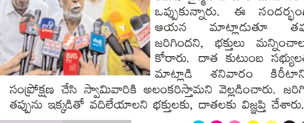
సంప్రక్కణ చేసి స్వామివారికి అలంకరిస్తామని వెల్లడించారు. జరిగిన తప్పును ఇక్కడితో పదితయాలని భక్తులకు, దాతలకు విజ్ఞప్తి చేశారు.

గుడివాడ, కలంకొంటర్ : గుడివాడ శ్రీ కళ్యాణ వెంకటేశ్వర స్వామి ఆలయాలకి చెందిన కోటి రూపాయల విలువైన స్వర్ణ కిరీటం మాయం వ్యవహారంలో చివరకు కాలిక్వి వచ్చింది. తాకట్టు వ్యాపారం నుంచి కిరీటాన్ని విడుదల చేసేందుకు ప్రభుత్వ విడిపించారు. శుక్రవారం ఆర్కైవ్స్ కళ్యాణమందిర ప్రాంగణంలో మీడియా ముందు కిరీటాన్ని కమిటీ సభ్యులు ప్రదర్శించారు.