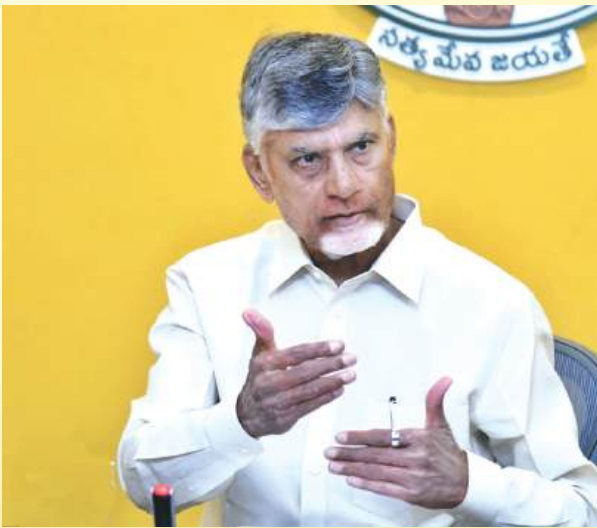
కాలువలు ఉన్న 570 కిలోమీటర్ల మేర రహదారులు పడే పడే ధ్వంసం అవుతున్నాయి. ఇలాంటి ప్రాంతాల్లో ఏ మెడియల్ తో రోడ్ల నిర్మాణం

జరిగితే బాగుంటుందనేది ఆలోచన చేయాలి. దీనిపై యూనివర్సిటీల్లో అధ్యయనం చేయిస్తే కొత్త ఆవిష్కరణలు వస్తాయి. గోదావరి పుష్కరాలను దృష్టిలో పెట్టుకుని గోదావరి, కృష్ణా, గుంటూరు జిల్లాల్లో రోడ్ల మరమ్మత్తులు చేపట్టండి. గోదావరి జిల్లాలు, కృష్ణా, గుంటూరు జిల్లాల్లో మొత్తంగా 471 గ్రామాల్లో రోడ్లను మరమ్మత్తులు చేపట్టాలి. గ్రేటర్ రాజమహేంద్రవరం పరిధిలో చేపట్టే రోడ్ల అభివృద్ధి అనేది అన్ని ప్రాంతాలకు రోల్ మోడల్ గా నిలిచేలా పనులు చేపట్టాలి. పుష్కరాలకు ఉమ్మడి తూర్పు, పశ్చిమ గోదావరి జిల్లాల్లో రూ.400 కోట్లతో 531 కిలోమీటర్ల పొడవైన రహదారులను అభివృద్ధి చేయాలి. దీని కోసం సాస్సీ నిధులను వినియోగించుకోవాలి. కుంభమేళా తరహాలో పుష్కరాలకు నిధులు ఇవ్వాలని కోరుతూ కేంద్రానికి లేఖ రాయాలని అని సీఎం సూచించారు.