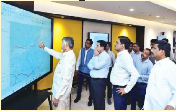
కొరత లేకుండా చూడాలి. వివిధ ప్రాంతాల్లో భౌగోళిక పరిస్థితులను అధ్యయనం చేసి దాని ఆధారంగా రహదారుల నిర్మాణం జరగాలి. రహదారి నిర్వహణకు ప్రామాణీకతను నిర్దేశించాలి. స్థానికంగా భౌగోళిక పరిస్థితులు, వాతావరణం అంశాలను పరిగణనలోకి తీసుకుని రోడ్ల నిర్వహణలో చర్యలు చేపట్టాలి. ఉమ్మడి ఉభయ గోదావరి జిల్లాలు, భాక్ కాలన్ సాయల్ ఉన్న చోట హైట్రైడ్ మోడల్ లో బీటీ లేదా వైట్ ట్యాప్ రోడ్ల నిర్మాణం చేపడితే బాగుంటుంది.

అమరావతి, కలంకౌంటర్ : రాష్ట్రంలోని వివిధ ప్రాంతాల్లో ఆర్థిక కార్యకలాపాలకు ఊతమిచ్చేలా జాతీయ, రాష్ట్ర రహదారుల నిర్మాణం జరగాలని ముఖ్యమంత్రి చంద్రబాబు నాయుడు దిశానిర్దేశం చేశారు. జాతీయ రహదారులు రాష్ట్రంలోని పోర్టులతో పాటు దేశంలోని వివిధ ప్రాంతాలను కనెక్ట్ చేసేలా నిర్మాణం చేపట్టాలని సూచించారు. సచివాలయంలో బుధవారం రహదారులు భవనాలు, రవాణా, జాతీయ రహదారి ప్రాజెక్టులపై ముఖ్యమంత్రి సమీక్షించారు. రాష్ట్రంలో రోడ్ల నిర్వహణ, పాత్ హోల్ శ్రీ రహదారులు, ఈవీ బస్సుల వినియోగం, వివిధ రాష్ట్రాలను అనుసంధానించేలా జాతీయ రహదారి ప్రాజెక్టుల నిర్మాణంపై సమీక్షించారు. ఈ సందర్భంగా ముఖ్యమంత్రి మాట్లాడుతూ... "రాష్ట్రంలో రహదారుల నిర్వహణ పటిష్టంగా ఉండాలి. మొత్తంగా 45,433 కిలోమీటర్ల మేర రోడ్లు ఉంటే... వాటిల్లో ఏటా 10,238 కిలోమీటర్ల మేర నిరంతర నిర్వహణ చేయాల్సి ఉంది. ప్రజలకు రోడ్ల వల్ల ఇబ్బంది లేకుండా చూడాలి. రోడ్ల నిర్వహణ అనేది నిరంతర ప్రక్రియగా చేపట్టాలి. ఎక్కడైనా రోడ్లకు గుంతులు పడితే... వాటిని వెంటనే సరిదిద్దితే ఇక ఇబ్బందులు ఉండవు. రోడ్ల నిర్వహణలో జాతీయ, అంతర్జాతీయ స్థాయిలో ఎలాంటి వద్దతులను అవలంబిస్తున్నారనే అంశాన్ని అధ్యయనం చేయాలి. ఆర్ అండ్ బీ రహదారుల మెయింటెనెన్స్ కోసం నిధుల