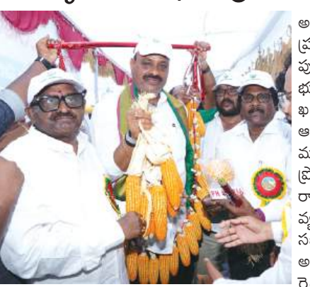
అందించవచ్చని ఆయన తెలిపారు. ప్రస్తుతం రసాయన ఎరువులు, పురుగుమందుల అధిక వినియోగం వల్ల భూమి నాణ్యత దెబ్బతింటోందని, రైతుల ఖర్చులు పెరుగుతున్నాయని మంత్రి ఆందోళన వ్యక్తం చేశారు. ఈ పరిస్థితిని మార్చడానికి సేంద్రియ వ్యవసాయాన్ని ప్రోత్సహించడం అత్యవసరమని చెప్పారు. రాష్ట్ర ప్రభుత్వం రైతులకు సేంద్రియ వ్యవసాయం వైపు మారేందుకు శిక్షణ, సబ్సిడీలు, మార్కెటింగ్ సదుపాయాలు అందిస్తున్న దని ఆయన వివరించారు. రైతులు ఉత్పత్తి చేసిన సేంద్రియ పంటలకు మంచి ధర లభించేలా ప్రత్యేక మార్కెట్టు ఏర్పాటు చేయడం జరుగుతోందన్నారు. భవిష్యత్ తరాలకు ఆరోగ్యకరమైన పర్యావరణం అందించాలనే సేంద్రియ వ్యవసాయాన్ని ప్రతి రైతు ఆదరించాల్సిన అవసరం ఉందని మంత్రి విలుపునిచ్చారు. రైతుల సంక్షేమం, ప్రజల ఆరోగ్యం దృష్ట్యా సేంద్రియ వ్యవసాయాన్ని విస్తృతంగా ప్రోత్సహించడానికి ప్రభుత్వం అన్ని చర్యలు తీసుకుంటుందని ఆయన స్పష్టం చేశారు. మార్చేరు వ్యవసాయ

పశ్చిమగోదావరి జిల్లా/మారుబేరు, కలంకౌంటర్ : రాష్ట్రంలో వ్యవసాయ రంగాన్ని స్థిరమైన అభివృద్ధి దిశగా తీసుకెళ్లడం కోసం కూలమి ప్రభుత్వం కట్టుబడి ఉందని వ్యవసాయ శాఖ మంత్రి కింజరాపు అచ్చెన్నాయుడు పేర్కొన్నారు. ఆచంట నియోజకవర్గంలోని, పెనుమంట్ల మండలం మారుబేరు వ్యవసాయ పరిశోధన కేంద్రంలో బుధవారం నిర్వహించిన "కిసాన్ మేళా" మారుతున్న వాతావరణ పరిస్థితులు -- సుస్థిర పరి వ్యవసాయం" కార్యక్రమంలో మంత్రి ముఖ్య అతిథిగా పాల్గొన్నారు. తొలుత పరిశోధన కేంద్రంలోని ల్యాబ్ లను పరిశీలించి, వ్యవసాయ రంగంలో ఉపయోగించే ఆధునిక యంత్రాలను స్వయంగా డ్రైవ్ చేశారు. ఈ సందర్భంగా రైతులను ఉద్దేశించి సభలో మాట్లాడుతూ సేంద్రియ వ్యవసాయం ద్వారా రైతులకు తక్కువ వ్యయంతో ఎక్కువ లాభాలు సాధ్యమవుతాయని, అదే సమయంలో భూమి సారాన్ని కాపాడుతూ ప్రజలకు ఆరోగ్యకరమైన ఆహారం