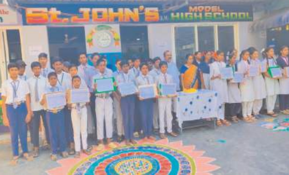
బంటుమిల్లి, కలంకౌంటర్ : ఆంధ్రప్రదేశ్ రాజధాని అమరావతిని

పార్లమెంటులో ఆమోదించడం పట్ల గురువారం బంటుమిల్లి పట్టణంలోని సెయింట్ జాన్స్ హై స్కూల్లో అమరావతి సంబరాలు నిర్వహించారు. ఈ సందర్భంగా విద్యార్థిని విద్యార్థులు ప్లే కార్డులు చేత వడ్డీ ప్రజా రాజధాని అమరావతి, అమరావతి అంటేనే అభివృద్ధి తదితర స్లాగ్స్ తో ప్లే కార్డులు చేతబట్టి హార్షం వ్యక్తం చేశారు. అలాగే పాఠశాల డైరెక్టర్ సాబుజాన్ ప్రిన్సిపాల్ రూగ్నీ సాబు లు కేక్ కట్ చేసి విద్యార్థిని విద్యార్థులకు ఉపాధ్యాయులకు స్వీట్లు పంపిణీ చేశారు. ఈ సందర్భంగా పాఠశాల డైరెక్టర్ సాబుజాన్ మాట్లాడుతూ ఇప్పటివరకు రాజధాని లేని మన రాష్ట్రానికి రాజధాని గా అమరావతిని పార్లమెంట్లో ఆమోదించడం ఎంతో సంతోషదాయకమని ప్రజా రాజధాని అమరావతి అభివృద్ధికి ఆటంకం ఉండదని అన్నారు. ఉపాధ్యాయుని ఉపాధ్యాయులు విద్యార్థులు ఈ కార్యక్రమంలో పాల్గొని తమ హృదయారావణములు వ్యక్తం చేశారు.