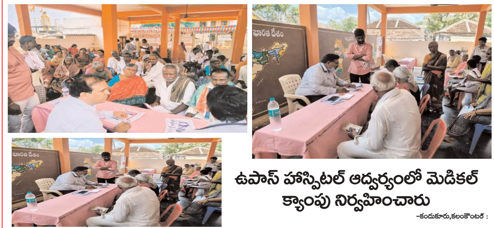
ఉపాస్ హాస్పిటల్ ఆధ్వర్యంలో మెడికల్ క్యాంపు నిర్వహించారు -కందుకూరు, కలంకొంటర్ :