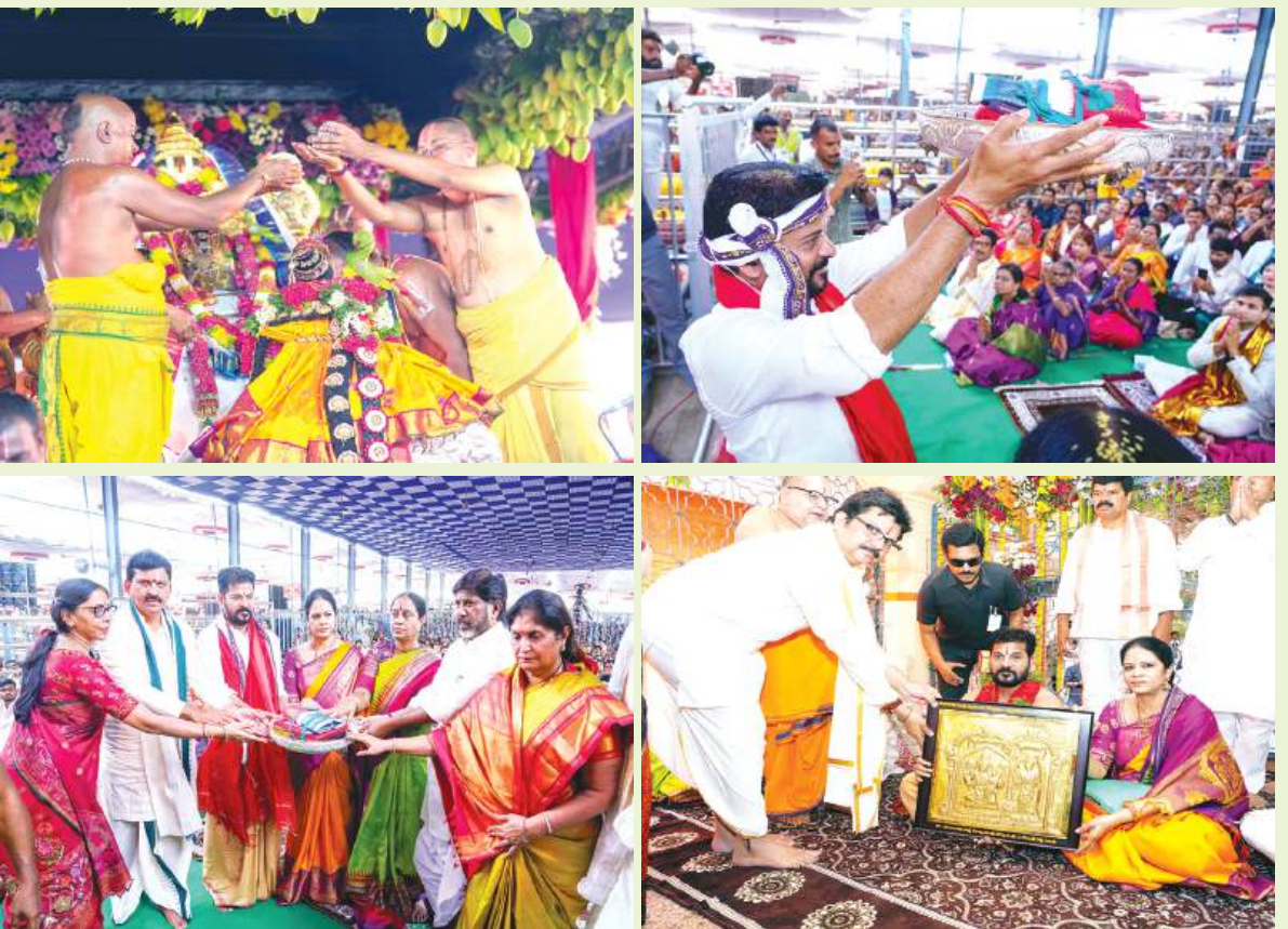
భద్రాచలం, కలంకౌంటర్ : శ్రీరామ నవమి సందర్భంగా పట్టువస్త్రాలు సమర్పించిన సీఎం రేవంత్ రెడ్డి కొనసాగింది. మిథిలా మండపంలో జరిగిన ఈ క్రతువును తిలకించేందుకు తెలుగు రాష్ట్రాల

-పట్టువస్త్రాలు సమర్పించిన సీఎం రేవంత్ రెడ్డి