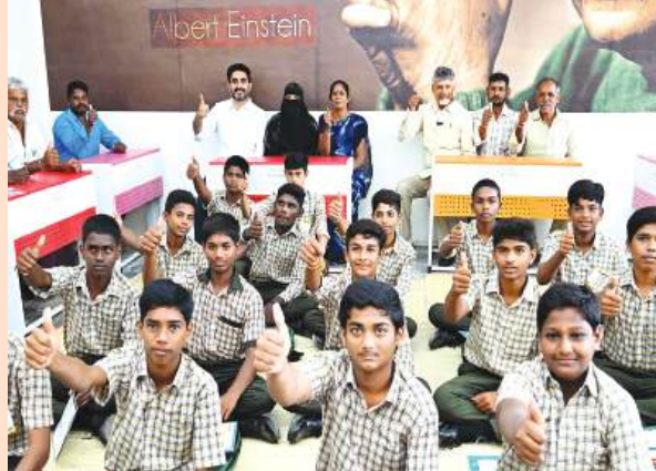
(మొదటి పేజీ తరువాయి)

ఇండిపెండెంట్ విల్ఫ్రైడ్ ద్వారా డేటాను 70% జూబిలీ యాప్ ద్వారా సేకరించారు. గిన్నిస్ పర్ఫార్మెన్స్ రికార్డు నియమించిన 40 మందికి పైగా ఆడిటర్లు ఈ అవార్డును నిర్ధారించడానికి 61000 పాఠశాలల నుండి సేకరించిన డేటాను విశ్లేషించారు. అధికారిక గిన్నిస్ ప్రపంచ రికార్డు ధృవపత్రం ఆగస్టు రెండవ వారంలో అమరావతిలో జరిగే ప్రత్యేక కార్యక్రమంలో అందజేస్తారు.